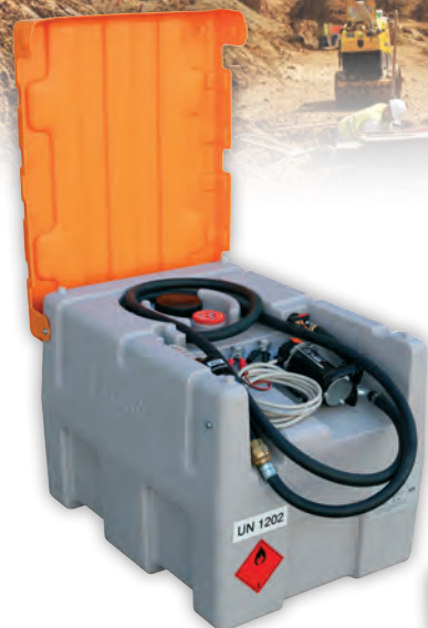
Easy Mobil 200 homologuée ADR

*Les tests ont été effectués par le TÜV (organisme de certification indépendant allemand)